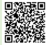
「ラーケーションの日」活動例