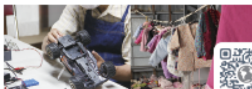
※詳しくはホームページをご覧ください

甚目寺コミュニティ協議会では地元の人とモノ、地域の人と人をつなぐ企画も展開、「甚目寺おもちゃ病院」ではドクターが思い出のおもちゃを修理、「おさがり交換会」ではサイズアウトやいただきもの等の子ども服等を交換、「子ども縁日」では射的やボールすくいなど懐かし遊びを体験出来ます。