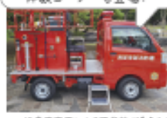
※内容変更により写真像が異なります